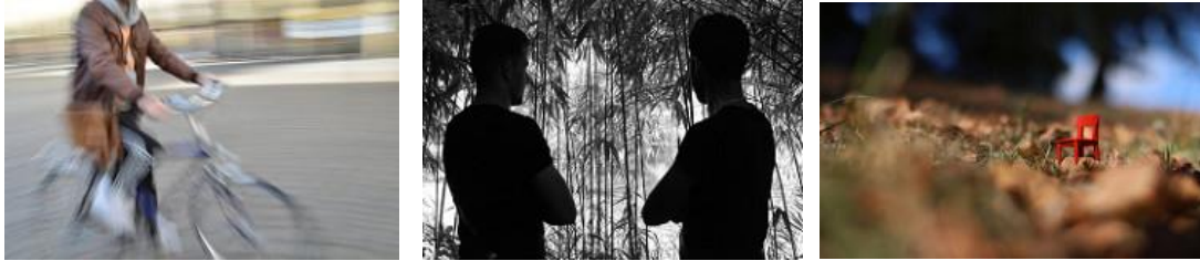
Fotos vom 1. Fotomarathon in Münster, Fotos: Andrea Bösing, Barbara Thiern, Michaela Kanthak

Das Jahr 2018 war für den Verein ein anstrengendes aber auch sehr erfolgreiches Jahr. Eingeleitet wurde das Jahr mit einem Fotowalk in Münsters Südviertel. Daraus entstand eine über drei monatige Fotoausstellung in Münsters Lokal Litfass. Weitere Fotowalks u. a. bei den Dülmener Wildpferden folgten. Workshops zur Foodfotografie, Langzeitbelichtung und zu Fotosoftware fanden sehr viel Resonanz. Alle Veranstaltungen und weitere Informationen findet ihr auf unserer Homepage und sollen hier nicht erneut aufgelistet werden. Das Organisations- und Planungsteam für den ersten Fotomarathon in Münster hatte ein umfangreiches Aufgabenpaket zu meistern. Der Erfolg hat uns dafür belohnt. Auch die Arbeitsfähigkeit des Vereins forderte uns so Einiges ab, wie Homepageerstellung, Onlineshop Einrichtung, Implementierung der Datenschutzgrundverordnung in unsere Onlinepräsenz, Gewinnung von Spendern/Sponsoren und Vieles mehr. Kleinere Pannen und Herausforderungen gab es natürlich auch, aber zum Glück nur wenige und behebbare. Gefreut hat uns besonders die durchgängig positive Resonanz auf die Organisation des Fotomarathons. Auf weitere Details soll hier an dieser Stelle gar nicht eingegangen werden, ich verweise noch einmal auf unsere Homepages und natürlich unsere Präsenz in zahlreichen sozialen Medien (Facebook, Instagram, Flickr, u. a.). Es war ein sehr positives und erfolgreiches Vereinsjahr.