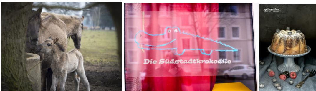
Fotos von Fotowalks und Workshops 2018, Fotografen: Eckhard Bode, Swen Nolte, Monika Kraß

Auch 2019 wird ein Schwerpunkt der Vereinsarbeit bei der Planung und Organisation des 2. Fotomarathons in